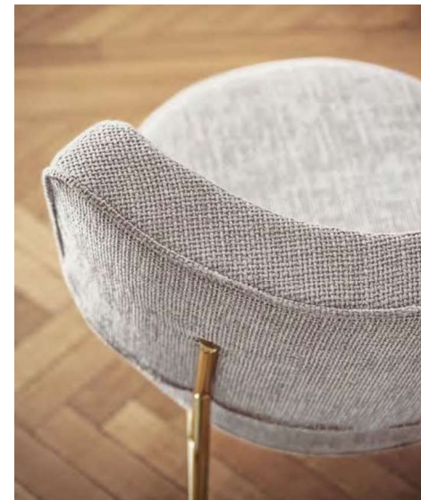
Coco Poltrona /Lounge chair CS3395