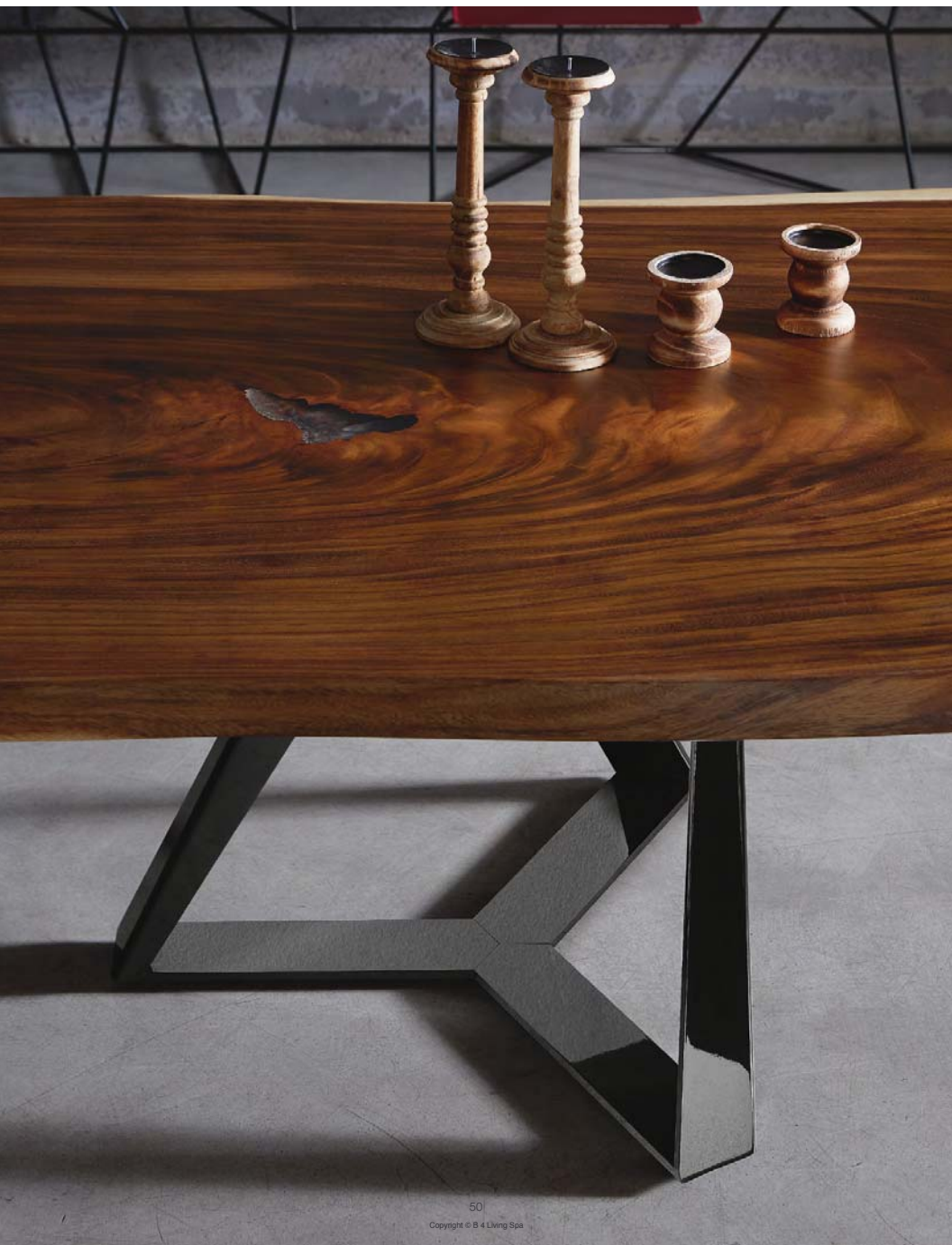
tavolo | table 20.99 Millennium XXL M327 nero profondo - glossy black L116 legno massello noce secolare heritage walnut solid wood