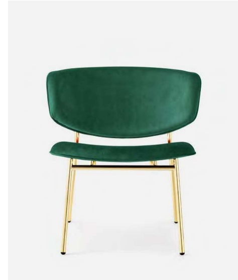
Fifties Poltrona / Lounge chair CS3416 P175 / S0H