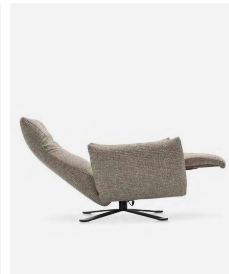
Polse Poltrona /Lounge chair CS3428