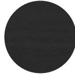
Frassino Nero Black Ash