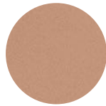
Oro Rosa Opaco Rose Gold Matt