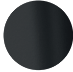
Laccato Nero Black Lacquered