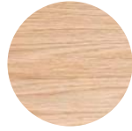
Rovere Fiammato Flamed Oak