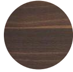
Rovere Termotrattato Heat-Treated Oak