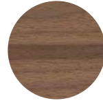
Noce Canaletto Canaletto Walnut