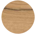
Rovere Vintage Vintage Oak