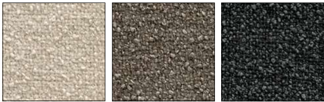
T2P SAND ARENA T2Q TAUPE TÓRTOLA T2R ANTHRACITE GREY GRIS ANTRACITA

VENICE | 100% PL gr/m 2 430 | Martindale >100.000 cicli/rubs - EN ISO 12947-2