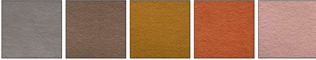
SLJ SAND ARENA SLK CAMEL BROWN COLOR CAMELLO SLL LEMON YELLOW LIMÓN SLM SAFFRON YELLOW AZAFRÁN SLN PINK ROSA