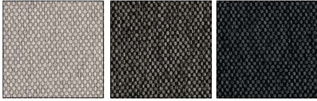
1SA3 SAND ARENA