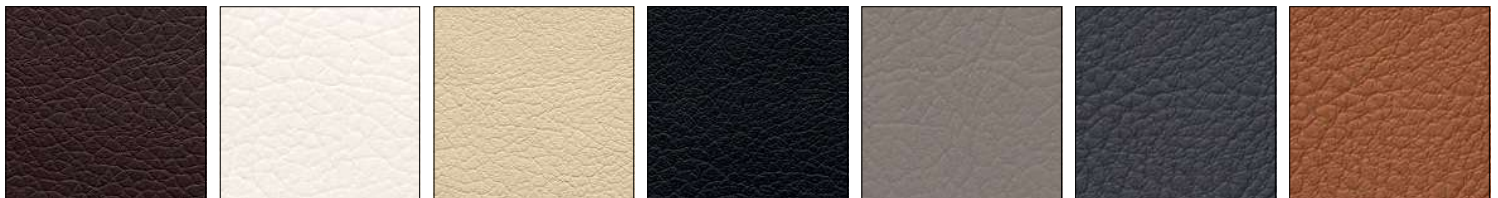
G8J MOKA CAFÉ