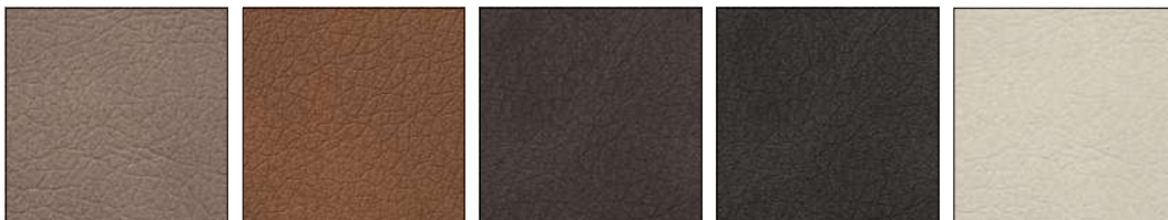
S0A DESERT DESIERTO S0B TOBACCO TABACO S0C EBONY ÉBANO S0W ASH GREY CENIZA S0X HEMP CÁÑAMO