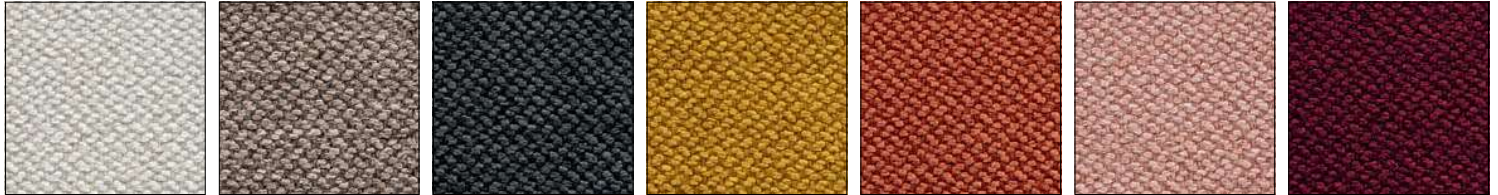
SKZ SAND ARENA