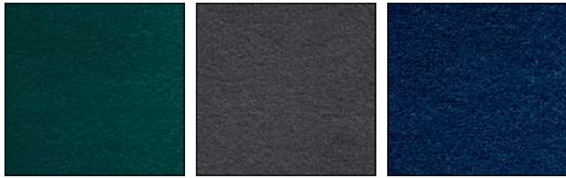
SLP FOREST GREEN VERDE BOSQUE SLQ GREY GRIS SYP BLUE AZUL

RAIN | 100% PL gr/m 2 490 | Martindale >100.000 cicli/rubs - EN ISO 12947-2