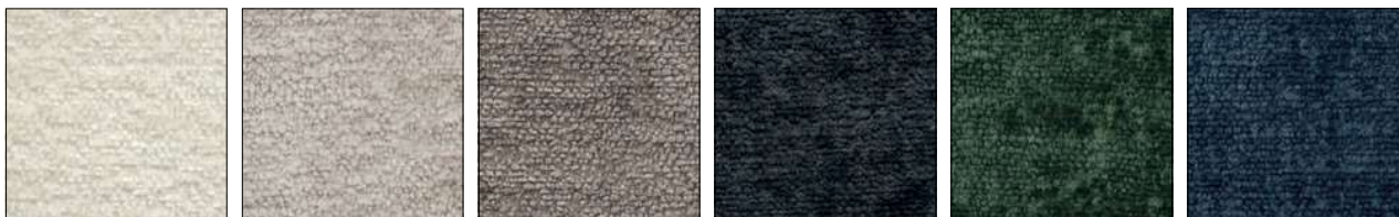
SYS IVORY MARFIL