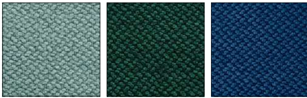
SLG THYME GREEN TOMILLO