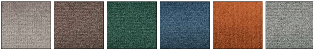
S0F SAND ARENA S0G SOIL BROWN TIERRA S0H FOREST GREEN VERDE BOSQUE S0J OCEAN BLUE OCÉANO S0K BRICK RED ROJO LADRILLO S0L ASH GREY CENIZA

VINTAGE | 80% PVC - 18% PL - 2% PU gr/m 2 600 | Martindale 50.000 cicli/rubs - EN ISO 5470-2 Met.1