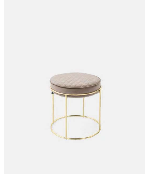
Atollo Pouf /Ottoman CS5104 P175 / S0F