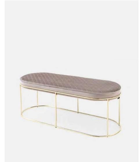
Atollo Panca /Bench CS5105 P175 / S0F