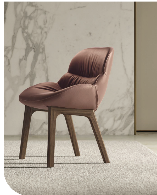
[In questa immagine] Amelie sedia cod. 34.91 struttura L006, rivestimento PR23 | Artistico tavolo cod. 20.02 struttura M329, piano CR006 | Blow rosone cod. 56.35RS struttura M328 | Blow lampada cod. 56.35S7B struttura e decentratore M352, vetro V009 | Blow lampada cod. 56.35STM struttura e decentratore M352, vetro V009 | Blow lampada cod. 56.35S7S struttura e decentratore M352, vetro V009 • [In this picture] Amelie chair cod. 34.91 frame L006, upholstery PR23 | Artistico table cod. 20.02 frame M329, top CR006 | Blow ceiling rose cod. 56.35RS frame M328 | Blow lamp cod. 56.35S7B frame M352, glass V009 | Blow lamp cod. 56.35STM frame M352, glass V009 | Blow lamp cod. 56.35S7S frame M352, glass V009